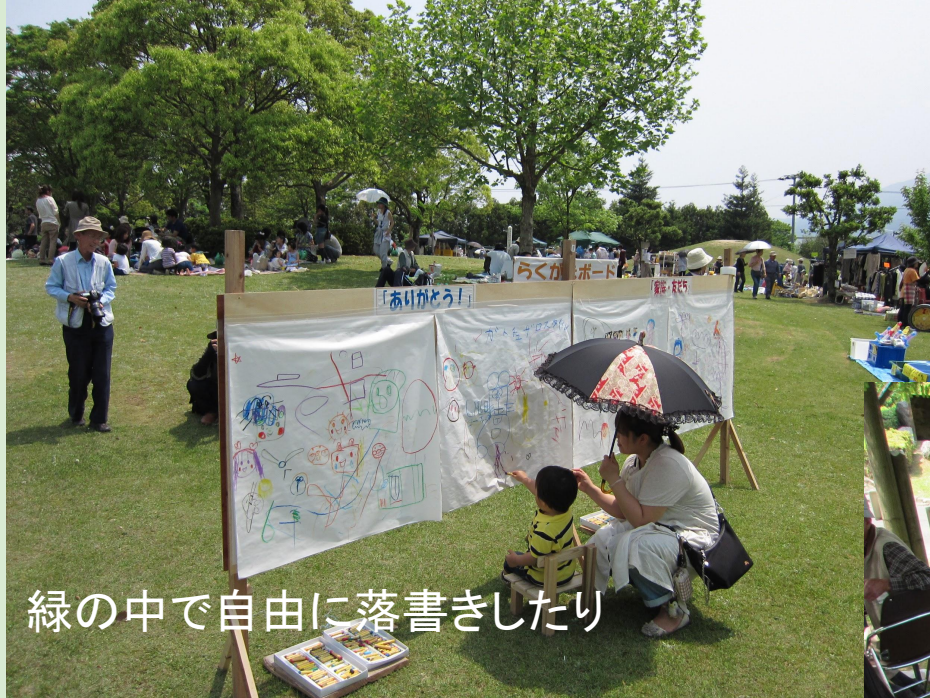
緑の中で自由に落書きしたり