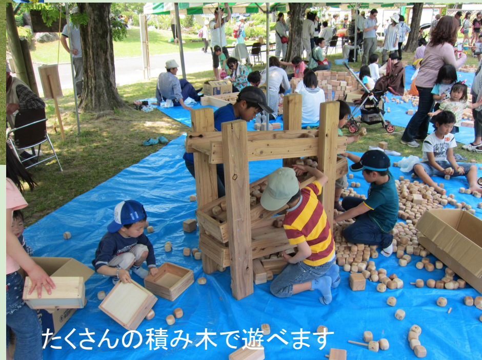
たくさんの積み木で遊べます