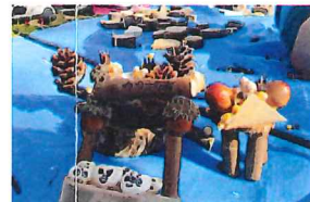
耳納の市(ネイチャークラフト体験)