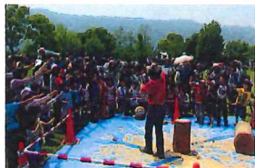
グリーンフェスティバル

グリーンフェスティバルや秋の音楽会など、新緑や紅葉を楽しみながら自然に親しむイベントがあります。木工体験や寄せ植え体験、あるいは茶庭でのお茶会など、季節の移ろいを楽しみながら感じてください。